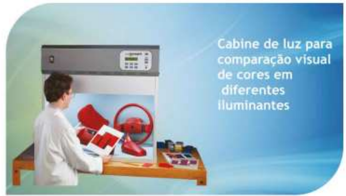
Cabine de luz para comparação visual de cores em diferentes iluminantes