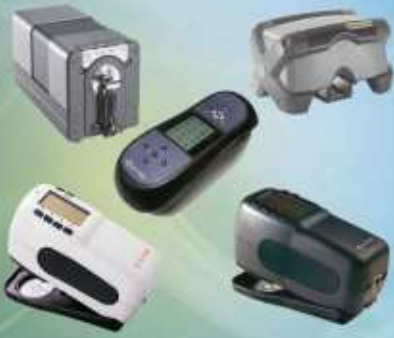
Espectrofotômetros Colorimétricos Fixos e Portáteis Densitômetros