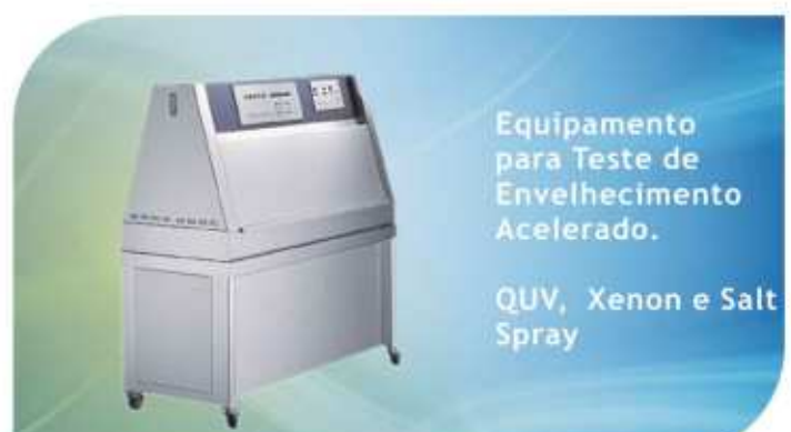
Equipamento para Teste de Envelhecimento Acelerado. QUV, Xenon e Salt Spray