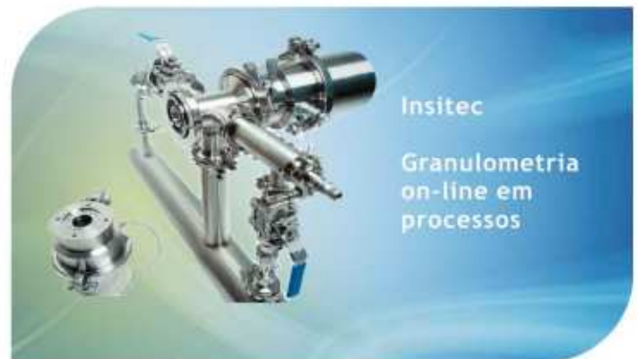
Insitac Granulometria on-line em processos