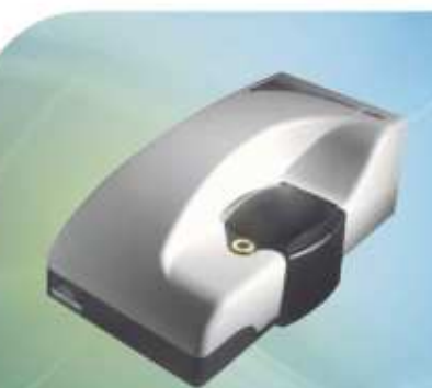
Medidores de Potencial Zeta e Tamanho de Partículas submicrons