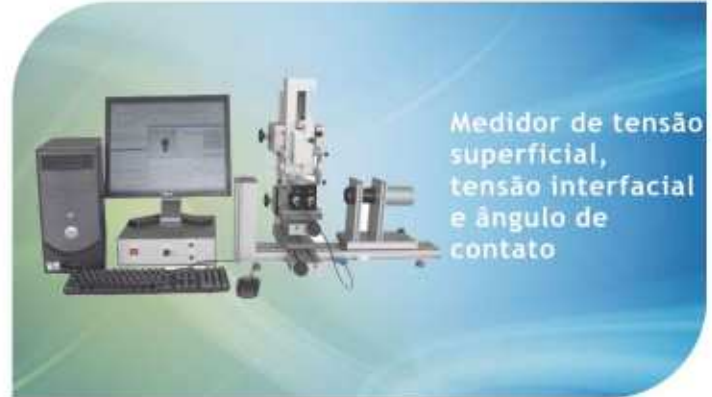
Medidor de tensão superficial, tensão interfacial e ângulo de contato