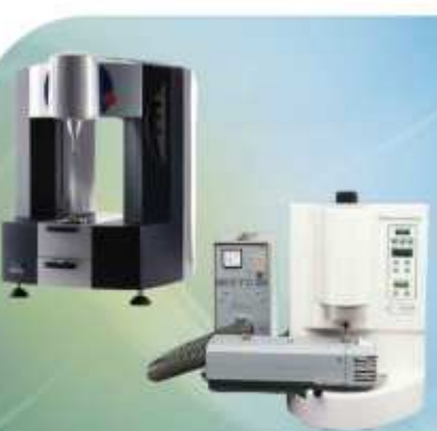
Reômetros e Viscosímetros de alta precisão