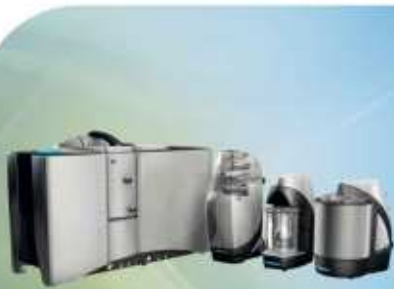
Granulômetros à Laser para análise do tamanho e distribuição de partículas em suspensão, pó e sprays