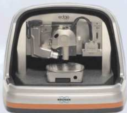
Microscópios AFM e SPM