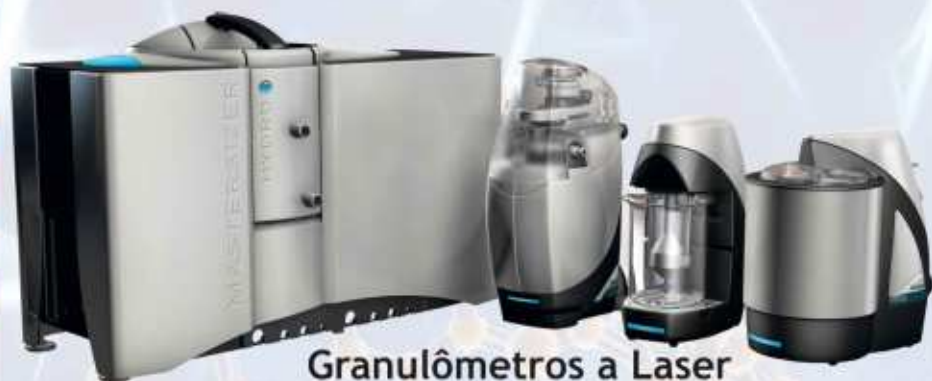
Granulômetros a Laser