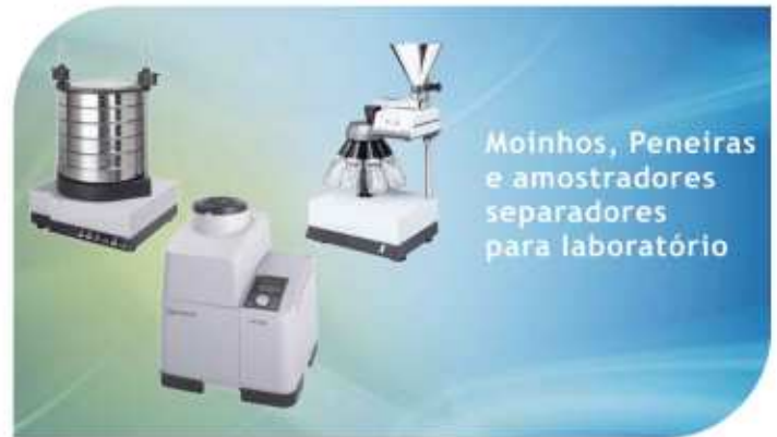
Moinhos, Peneiras e amostradores separadores para laboratório