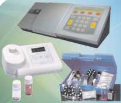
Colorímetros, Turbidímetros e Comparadores colorimétricos para cor de óleos vegetais, minerais, petróleo e derivados como: AOCS, Lovibond, Gardner, Saybolt, etc.